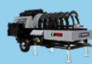
RECUPERATOARE DE NISIP