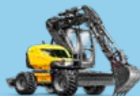
MULTIFUNCȚIONALE PE PNEURI