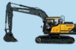
EXCAVATOARE PE ȘENILE