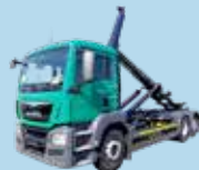
CAMIOANE CU CÂRLIG