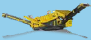
STAȚII DE SORTARE MOBILE