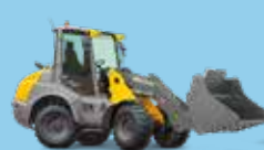
ÎNCĂRCĂTOARE CU BRAȚ PIVOTANT