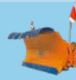
LAME ȘI FREZE DE ZĂPADĂ