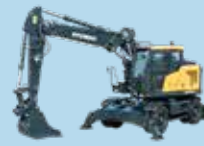
EXCAVATOARE PE PNEURI